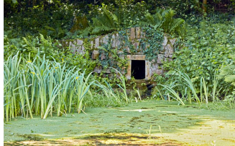
Der Quelltümpel „Butterborn“, 2025