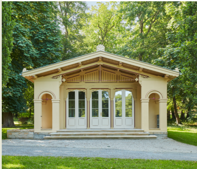
Das sanierte Prinzenhaus, 2025

Einen weiteren Akzent in diesem Teil des Parks setzt der Schwei- bach, dessen Lauf landschaftlich inszeniert, mit Natursteinen eingefasst und durch Brücken erlebbar gemacht wurde. In diesem Parkbereich verbinden sich gärtnerische Präzision und ein feines Gespür für Raumwirkung und Blickbeziehungen. Das Ergebnis ist ein Gartenraum mit besonderer Atmosphäre.