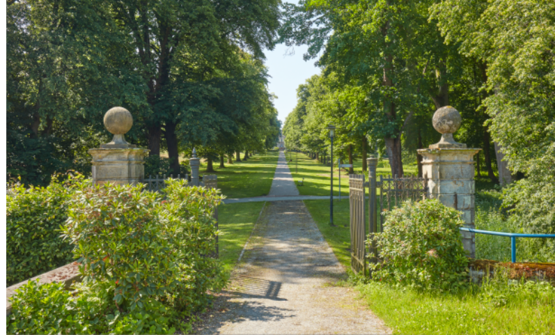
Nördliches Eingangstor mit Blick in die Lindenallee, 2025

Historische Karte, 1848