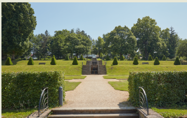
Blick von der Südseite des Schlosses auf die drei Terrassen, 2025

Ziel ist es, die gestalterischen Qualitäten dieses bedeutenden kulturellen Erbes zu erhalten, es für Besucherinnen und Besucher erlebbar zu machen und so das Gartendenkmal Schlosspark Schieder zu bewahren. Dieses Anliegen verfolgt die Stadt Schieder-Schwalenberg gemeinsam mit dem Förderverein Schloss und Schlosspark Schieder e. V. mit großem Engagement.