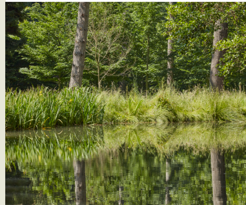
Blick über den Schwanenteich, 2025