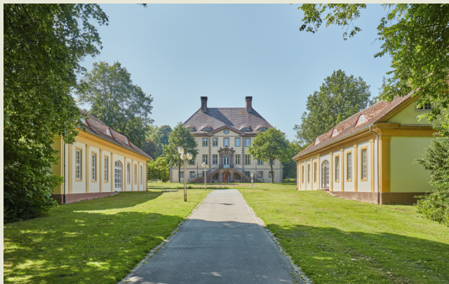
Blick zwischen Marstall (links) und Remise (rechts) auf das Schloss, 2025