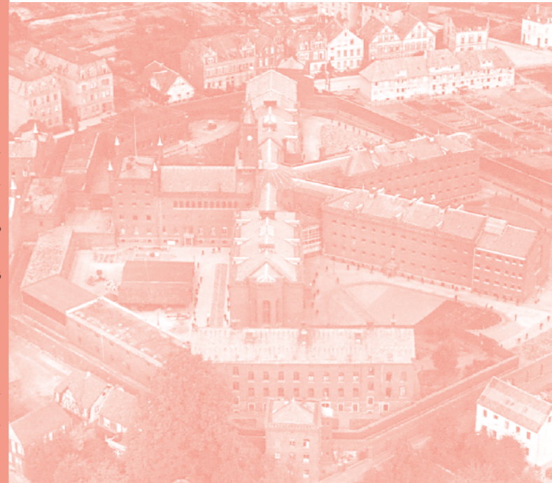
Titel: Stadtarchiv Münster, Sammlung Eugen Müller, 1923; Einleitung: JVA Münster, Ansicht Gartenstraße, Einfahrt mit dreiflügeliger Torsituation, 2010, Foto: LWL/H. Dülberg; Nebengebäude, 2022, Foto: Wilhelm Walterscheid

Ausstellung mit Studienentwürfen und Begleitprogramm