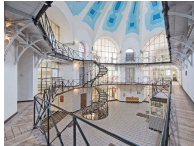
Zentral: Panoptisches System – Justizvollzugsanstalt Münster. Blick durch die Zentrale in Richtung Flügel IV, 2010.

Aktuelle Außen- und Innenaufnahmen zeigen das Prinzip der Anlage: Strahlenförmige Zelltrakte mit Panoptikum zur Beobachtung der Insassen.