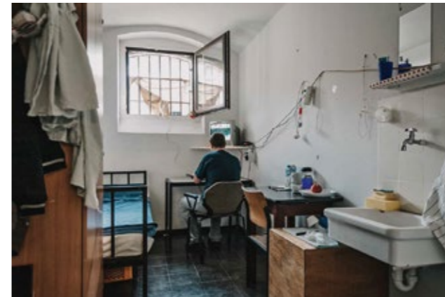
Beengt: Einzelzelle (7,4 qm) mit Ausstattung, 2013.

Bis heute wird die Anlage in Teilen genutzt. Der Fotograf Ansgar Dlugos hielt den Alltag in der JVA fotografisch fest – Leben auf Zeit.