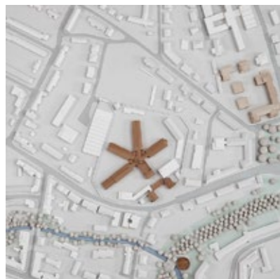
Signifikant: JVA Münster im Stadtmodell.

Das Stadtmodell 1:500 veranschaulicht die zentrale Lage sowie die sternförmige Form der JVA an der Gartenstraße. Benachbart liegen Zwinger und Promenade.